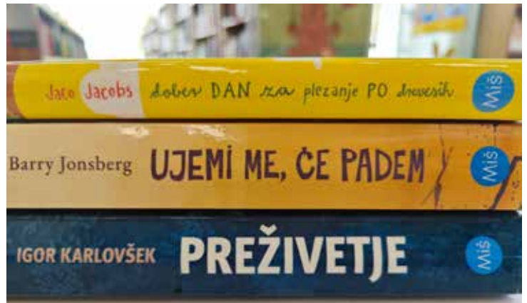
Primer hrbtne poezije

In še obvestilo za vse Pikine bralce, ki sodelujejo pri Pikini bralni znački: v knjižnici ne pozabite oddati svojih beležk, saj vas bo le tako lahko Pika Nogavička v mesecu septembru povabila na podelitev.