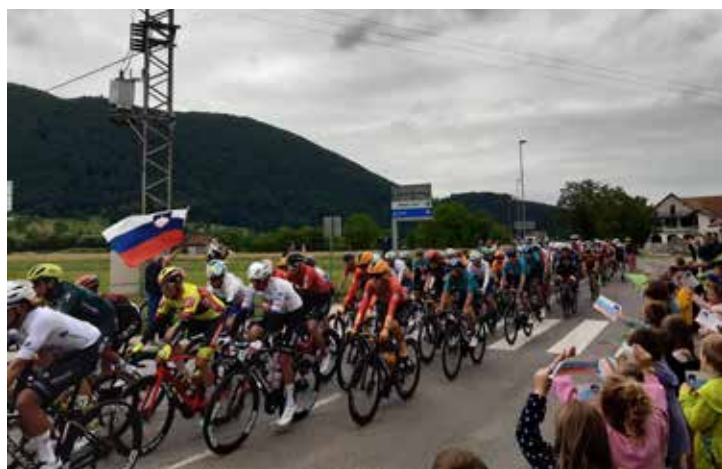
Dirka po Sloveniji

Radi imamo utrip vseh generacij! In s to mislijo smo pripravili tudi letošnjo osrednjo občinsko proslavo v počastitev dneva državnosti, ki bo simpatičen preplet generacij v predprazničnem ponedeljku, 24. junija, ob 18.30, na odru našega kulturnega doma.