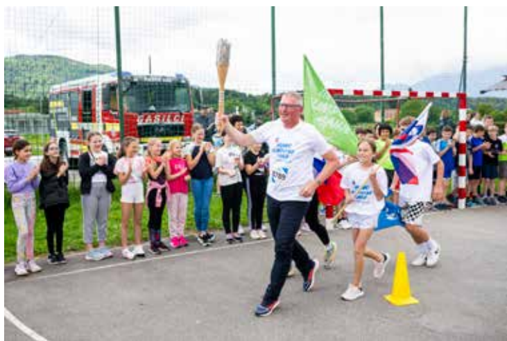
Prihod slovenske bakle