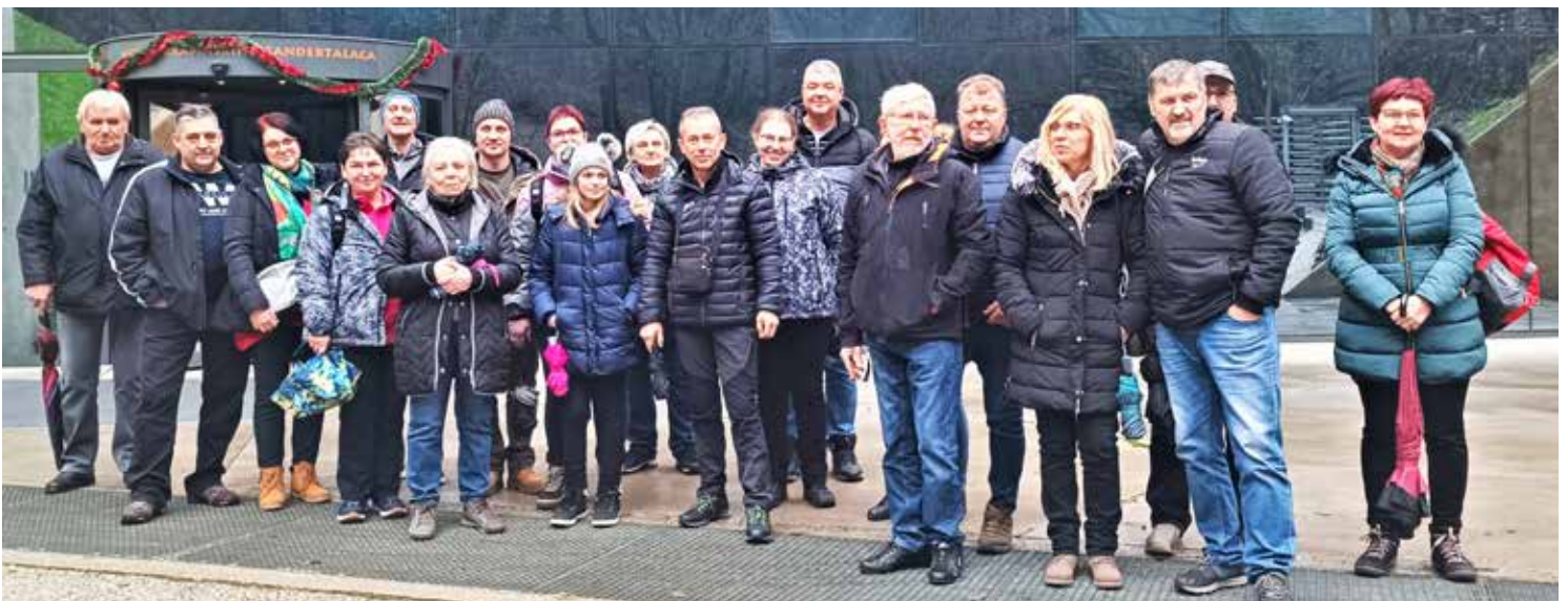
Gasilska fotografija udeležencev ekskurzije pred Muzejem krapinskega pračloveka

Zvečer smo prijetno utrujeni od ogledov prispeli v Stubičke toplice. Naslednji dan obiskali še Zagreb, nato pa se tretji dan polni lepih vtisov in novih informacij vrnili domov.