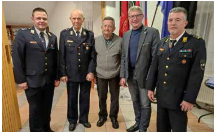
Prejemnika značke za 70-letno aktivno delo v gasilstvu z vodstvom društva in županom

V soboto, 21. januarja, je v Paški vasi potekal 103. občni zbor PGD Paška vas, dan prej pa je bil v društvu uspešno izpeljan zbor mladih. Številčna udeležba na obeh zborih dokazuje, da društvo dobro deluje.