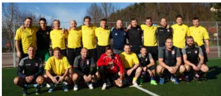
Rumena združena ekipa Tulipanov in Kluba 81 ter Netopirji v sivi opravi smo tudi letos del silvestrskega popoldneva preživeli na medsebojnem nogometnem srečanju

Igralci smo prikazali dobro igro in z njo navdušili gledalce. Kljub tekmovalnosti smo jo tudi tokrat odigrali brez sodnika, v duhu spoštovanja in »fair playa«. Nasmehi na obrazih igralcev po končani tekmi in sproščen klepet ob bograču so dobra popotnica za nadaljnja medsebojna srečanja.