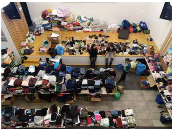
Kar nekaj parov rok in opravljenih ur je bilo potrebnih, da so bila oblačila zložena po spolu, velikostih, priložnosti ... Tako je bilo iskanje enostavnejše in hitrejše.

Ob opazovanju razdejanja, ki sta ga za sabo pustili Paka in Savinja smo res ostali brez besed, a ne brez srca. Dan solidarnosti je že zdavnaj minil, tudi avgusta je konec, a stiske ostajajo. Ne pozabimo nanje! Ob tej priložnosti vas vabimo na otvoritveni dogodek Poznopoletnega festivala, ki bo v petek, 1. septembra, in bo dobrodelno obarvan.