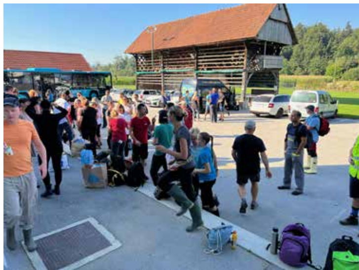
Zbiranje prostovoljcev na dan solidarnosti.

Iskreno se zahvaljujemo vsem, ki ste pomagali pri vzpostavitvi zbirnega centra in njegovem vsakodnevnem urejanju. Hvala vsem, ki ste kakorkoli drugače prostovoljili v ali okrog MC-ja.