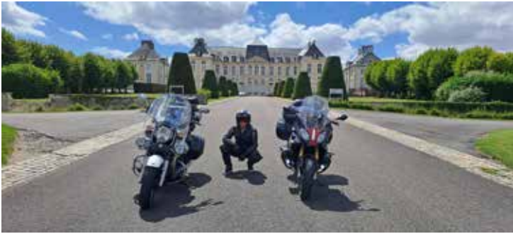
Brienne le Chateau v Šampaniji

Dva Pakenštajna pa sva to čudovito pokrajino ob Atlantskem oceanu in njen zgodovinski pomen izbrala za cilj poletnega motopotepanja. Prva polovica julija je tudi pri nas skoparila z vročino, zato so naju visoke temperature spremljale le prvi dan, ko sva po celodnevni vožnji parkirala v dolini Aoste, malo pred pobočjem veličastnega Mont Blanca. Naslednje jutro sva se preko prelaza Sv. Bernarda spustila v osrčje Francije, prečkala reko Rono ter se zvečer utaborila v naravnem rezervatu Lavradojskih gričev in planjav. Sledilo je prečkanje vulkanskih vrhov Puy Mary in obrat na sever v smeri Atlantika, ki sva ga uzrla četrty dan potovanja, pri Nantesu, ob prečkanju lijakastega izliva reke Loire.