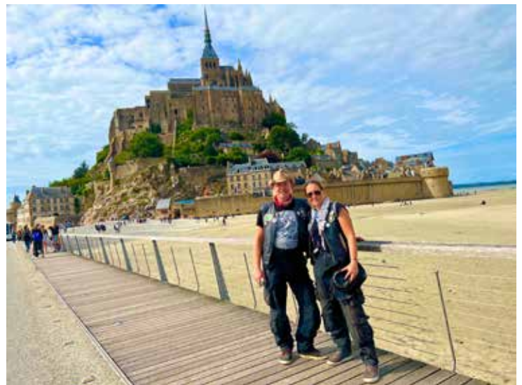
Mont Saint Michel

najrazličnejše vojaške opreme. Za ogled Airborne muzeja ter številnih spomenikov na obalah izkrcanja sva namenila cel dan najinega časa, pa sva še veliko izpustila. Še danes številne hiše v vaseh krasijo zastave držav, ki so svoje vojake poslale osvobajati Francijo. Spomin na tiste dni je živ in opazen na vsakem koraku. Obalni nasipi lijakasto razbrazdani od eksplozij granat ter širna vojaška pokopališča pa bodo večno pričali o žrtvah, ki so padale na obeh straneh.